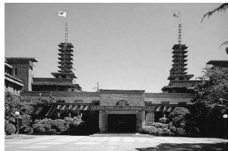
甲子園会館(武庫川女子大学) 正面

J R 東海道 (神戸) 線甲子園口駅南改札を出て、駅前ロータリーから南東方向へ 徒歩約 10 分